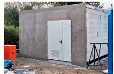
Der Heizhaus-Bau Ende Oktober

Der Wohnbereich Groß-Ziethener-Chaussee soll eine eigene Heizung mit Heizhaus bekommen. Mit den Arbeiten haben wir