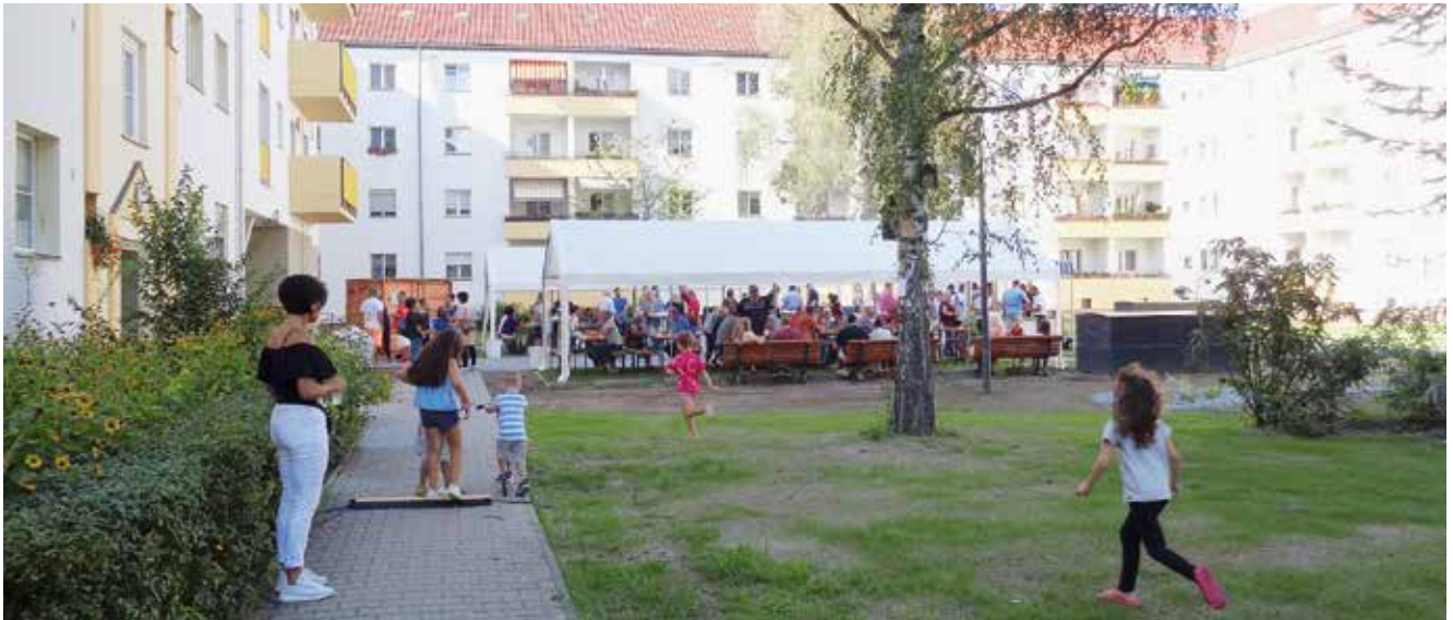
Abschlussfest im Monschauer Weg