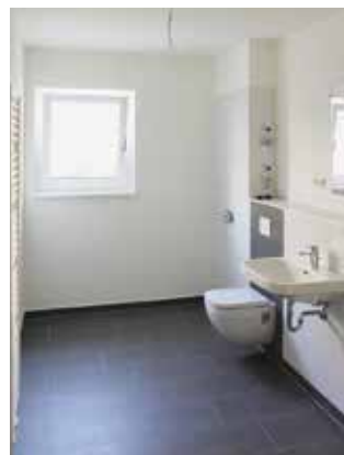
Bad mit bodentiefer Dusche