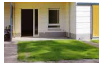
Terrasse mit kleinem Mietergarten