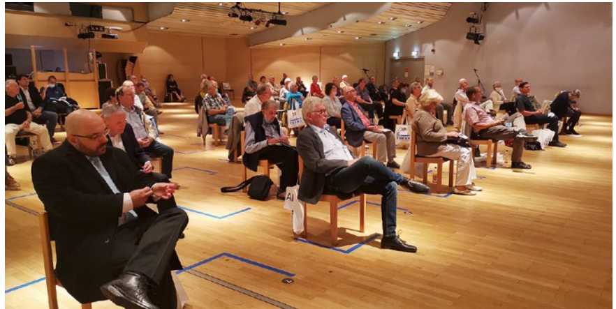
Vertreterversammlung mit Abstand

Unsere diesjährige Vertreterversammlung fand am 24. September 2020 statt – selbstverständlich mit Hygienekonzept und unter Einhaltung der Abstandsregeln. Aufsichtsrat, Vorstand und Mitarbeiter konnten 43 von 78 Vertretern um 18 Uhr im Großen Saal des Gemeinschaftshauses Gropiusstadt (Bat-Yam-Platz 1) begrüßen.