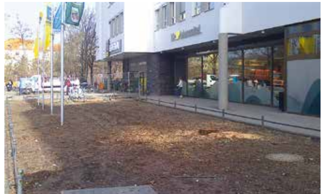
Britzer Damm 55: Neugestaltung der Freiflächen