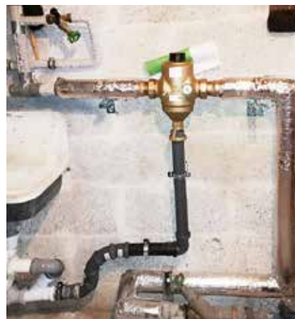
Erneuerung Wasserfilter mit Anschluss an das Ausgussbecken

Hier werden weiterhin die Regenwasser- und Schmutzwasserleitungen erneuert und Trinkwasserfilter nachgerüstet.