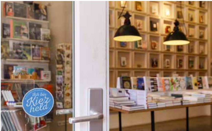
Kiezheld: Buchhandlung Usklar &amp; Rai