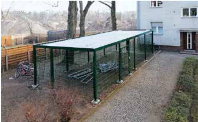
Fahrradkäfig in Britz