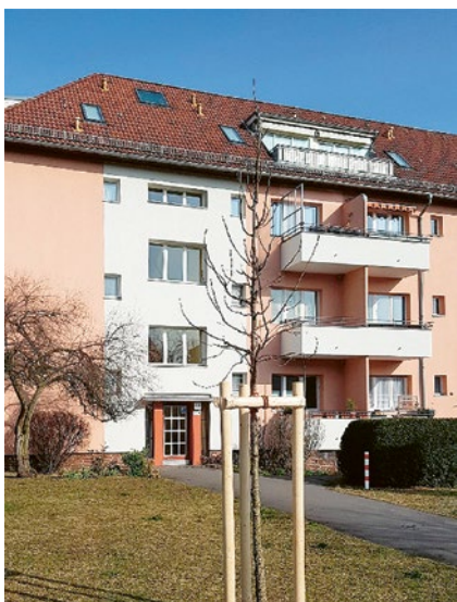
Neupflanzung in Britz