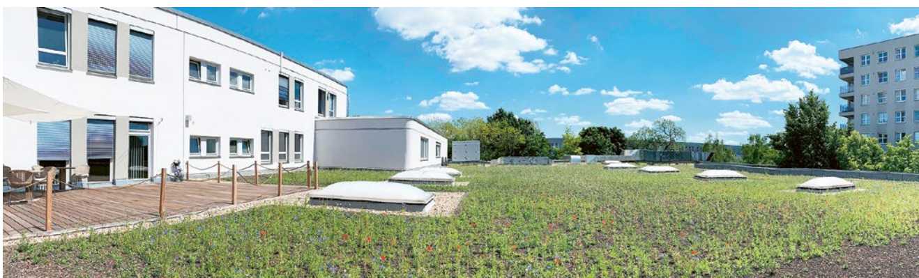
Unser Gründach an der Geschäftsstelle macht seinem Namen endlich Ehre.

hinaus sorgt es für besseres Klima in der Umgebung, denn grüne Dächer wirken der Hitze in der Stadt entgegen und speichern auch Wasser, welches dann nicht in den Kanal fließt.