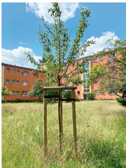
Obstbäume in Marienfelde