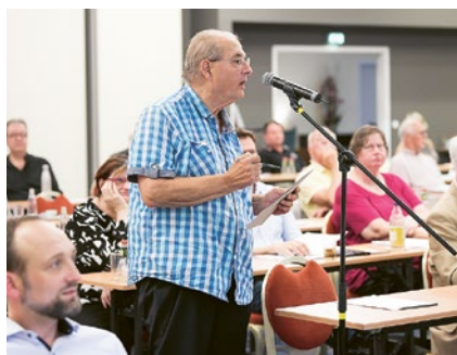
Vertreter stellt eine Frage.

konnten wir mit einem Generalunternehmer zumindest den erweiterten Rohbau vereinbaren. Im IV. Quartal 2022 hat sich die Lage am Baumarkt etwas beruhigt und so konnten wir Folgegewerke mit den Leistungen beauftragen. Als weitere energetische Maßnahmen wurden auf dem Gebäude der Geschäftsstelle eine Photovoltaik-Anlage aufgebaut und die Lade-Infrastruktur für Elektrofahr-