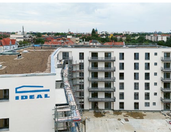
Im Juli: Der Neubau ist teilweise abgerüstet.