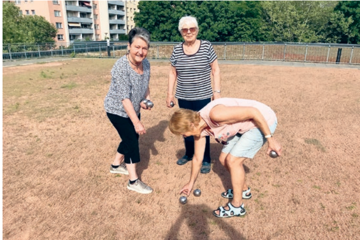
Das Spiel macht gute Laune

Dieses Mal hatten wir das Wetter auf unserer Seite. Bei herrlichem Sonnenschein konnten wir mit ca. 25 Personen auf unserem Parkdeck in der Fritz-Erler-Allee den Bouleplatz beleben.