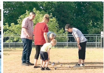
Welche Kugel liegt jetzt näher?