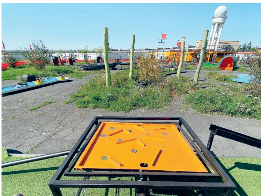
Tempelhofer Feld: nature Mini ART Golf, „Die Goldwaage“ von Christoph Ernst

Auch diese Bahnen existieren seit Anfang der 60er und man sieht ihnen ihr Alter durchaus an. Aber seit der Wiedereröffnung der Anlage 2014 wird behutsam und kontinuierlich in Eigenleistung renoviert. Dabei soll der Charme der frühen 60er Jahre soll erhalten bleiben und gleichzeitig heutige Ansprüche erfüllen. Der zentral gelegene Biergarten ist das Herzstück der Anlage, wo sich