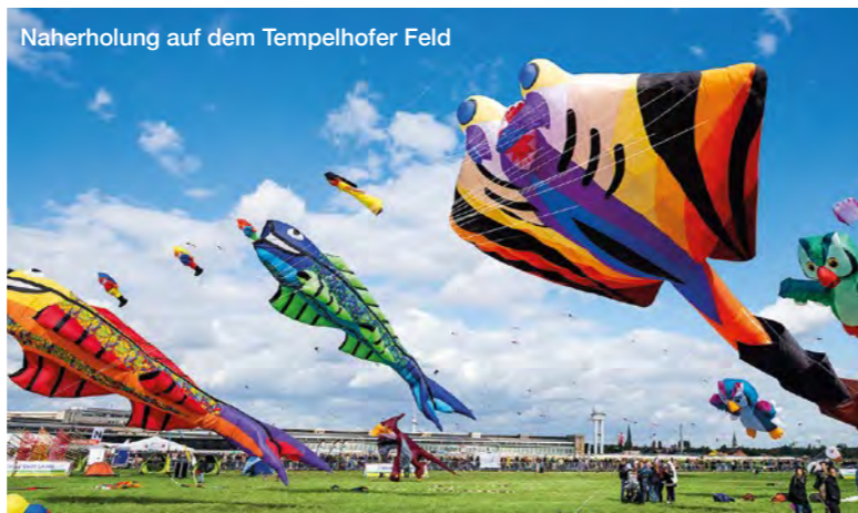
Naherholung auf dem Tempelhofer Feld